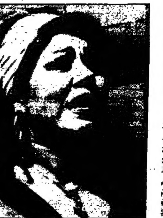
ميكتم مع سعيد صالح في مشهد من أحد أفلامها

فما كان من المشادات إلا أن توجه للممثل محمود حميدة متوجع مسرحيته والتي شارك في بطولتها حنان شوقي ووليام مكي، وأخبره بما يمر من ضياء البرقي وأمره لعود من توكه في الأذهاب لنعابه وتلقبه برسا في أصول التعامل مع الآخرين وتصح حميدة المشادات بالترتيب والتفاهوت مع هياتم من أجل حشها على التراجع عن استخدام اسم المسرحية. لكن المشادات الزر من لقاء نفسه الأذهاب للمبرقي وأصدقائه من أجل منعهم من استغلال الاسم والممثل اللقبى به خلال اليومين للتأشير في أحد المطاعم وتصمحه بالتراجع. لكن ضياء أصغر على موقفه وغادر المكان وكند المشادات له قبل أن يفرقه بأنه سوف يقدم كثيرا لو أم يتراجع عن موقفه وسيتركه له علامة